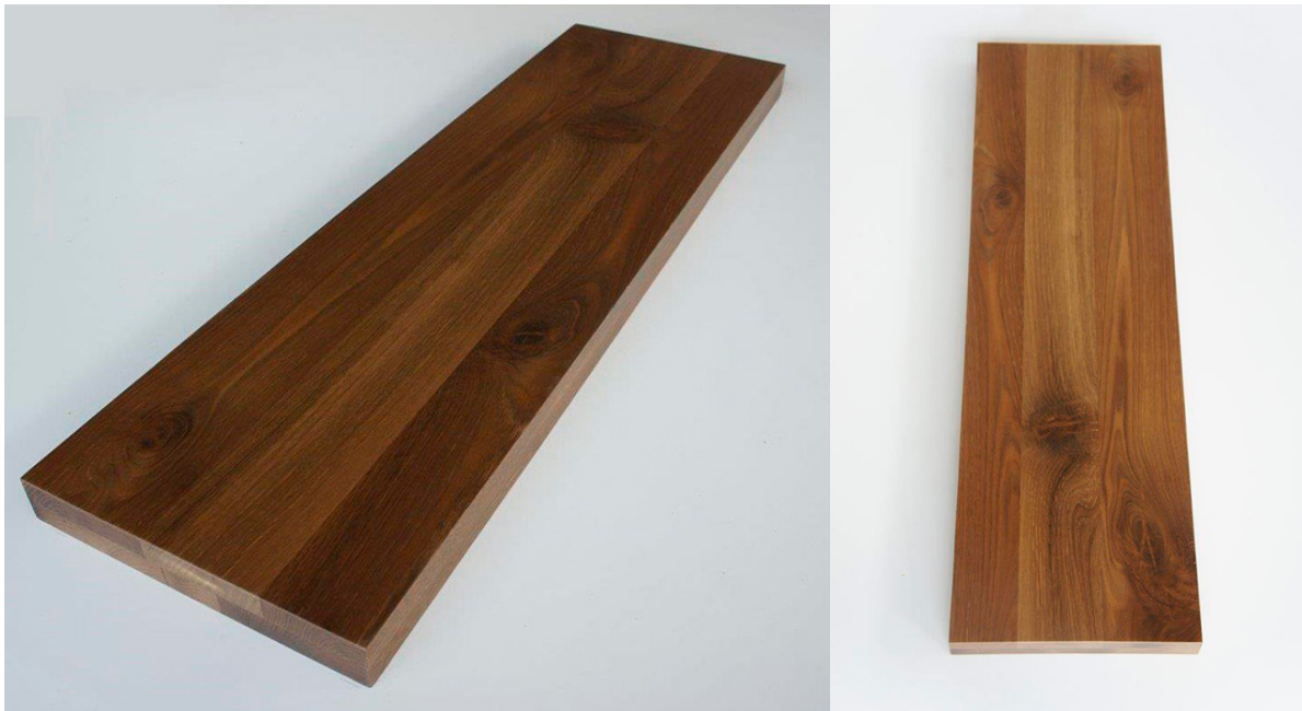
Dąb czerwony - górna strona

Jeżeli wybieramy meble i ozdoby wykończone drewnem lub fornirem, należy pamiętać, że muszą one korespondować z podłogą pod względem usłojenia i barwy. Jednak niekoniecznie musi być to ten sam gatunek drewna.