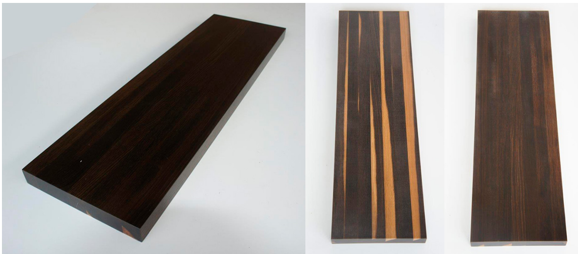
Dąb wędzony - dolna i górna strona

W przypadku dobierania kolorów ścian to ciemna podłoga pasuje do wielu kolorów, więc w tym miejscu użytkownik może mieć wielki wybór. Nie poleca się jednak zbyt dużego kontrastu. Przebywanie w pomieszczeniu, w którym białe ściany otaczają ciemną podłogę może być męczące. Zaleca się w tym wypadku stosowanie ciepłych kolorów. Można jedną ze ścian pokryć dodatkowo ciemną farbą lub tapetą.